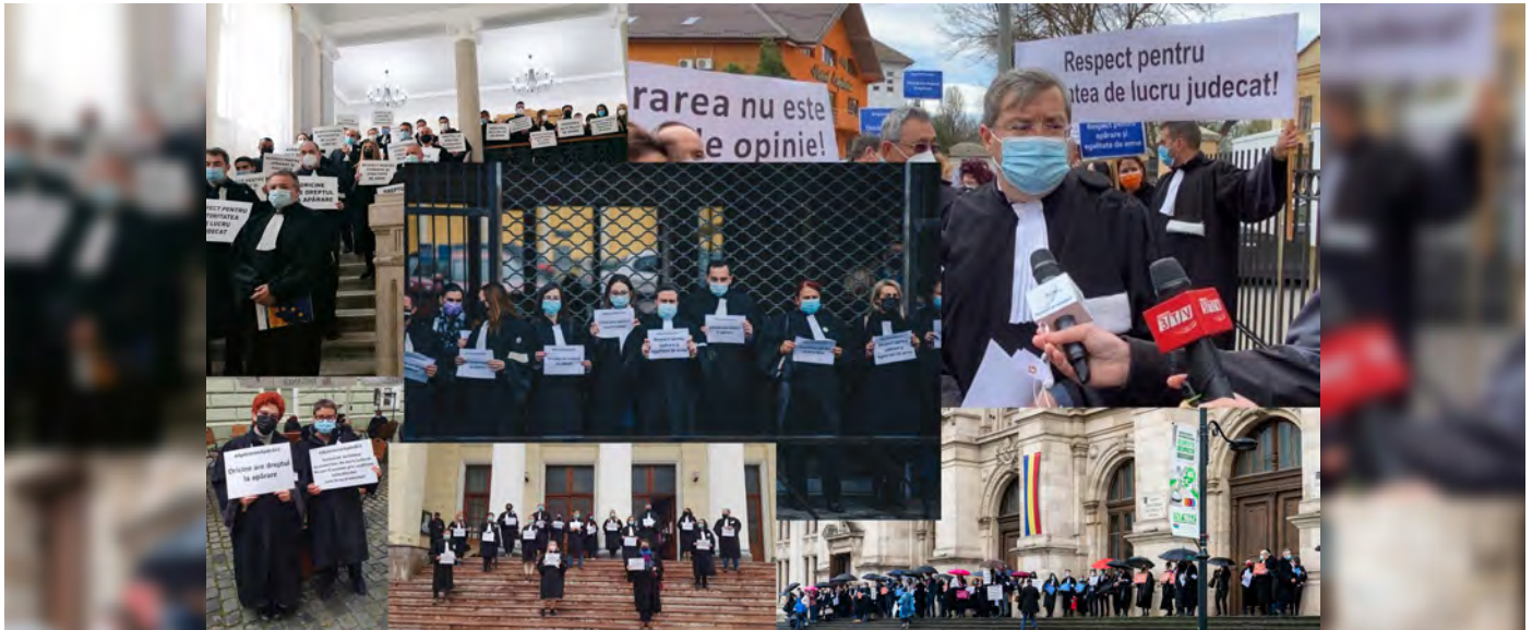
Galerie foto cu toate imaginile de la barourile din țară aici

14 Aprilie 2021 | Video: Avocații, barourile și UNBR solicită respectarea standardelor recunoscute național și internațional privind libertatea de exercitare a profesiei de avocat